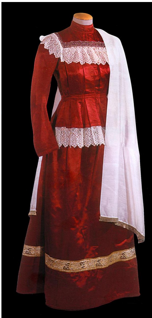
Приложение 3 Вологодская парочка